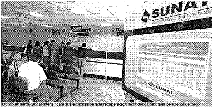
Cumplimiento. Sunat intensificará sus acciones para la recuperación de la deuda tributaria pendiente de pago.

Esta medida, junto a aquellas iniciadas recientemente por la Sunat como es la declaratoria de insolvencia de las 12 principales empresas deudoras al fisco y la convocatoria de remates masivos y en simultáneo en diversas intendencias del país, forman parte de un programa bastante agresivo para la recuperación de deudas pendientes de pago, que superarán los 48 mil millones de nuevos soles.