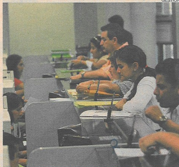
La recaudación en el primer trimestre creció en 16.8%.

En el caso de las rentas por cuarta categoría destaca que tras nueve meses consecutivos de registrar aumentos continuos, en marzo cayeron los pagos a cuenta y retenciones de los trabajadores independientes, presentando una caída de 4.6% respecto a marzo del 2010.