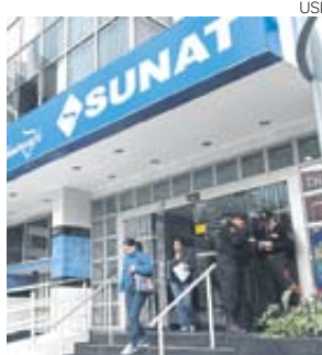
Sunat. Dará respuestas vinculantes.

El Ejecutivo implementará progresivamente un nuevo procedimiento de absolución de consultas a los particulares, con el objetivo de responder a las empresas en un plazo máximo de 4 meses, de forma vinculante, sobre el régimen tributario aplicable.